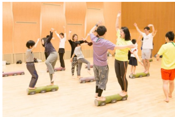
○自由に遊べる「キッズFRP」エリア内では、親子で参加できる体験クラスも。