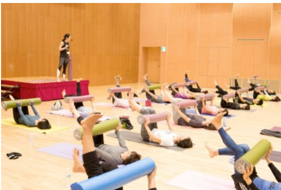
○「腰痛予防のためのピラティス」など一般向け体験クラス（無料）を開催。