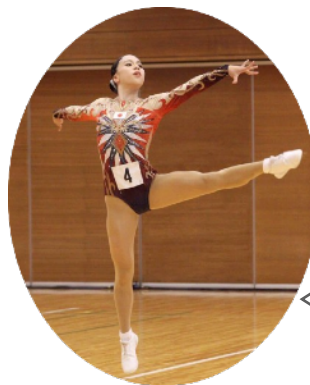
地元 岡山在住の エアロビクス競技 日本代表選手との コラボレーション企画も 開催（参加費無料）。