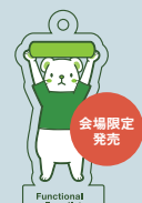
FRP公式キャラクターおこらび