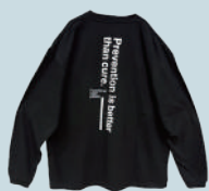
FRP ロングスリーブTシャツ 2024

※会場での販売は数に限りがあり、また事前予約価格は適用されませんので、あらかじめご了承ください。