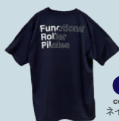
FRP Tシャツ 2024